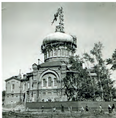
Поднятие креста в 1947 г.

и Барнаульский Варфоломей «при громадном стечении народа, радовавшегося и этому торжеству, и вообще открытию церкви», храм освятил.